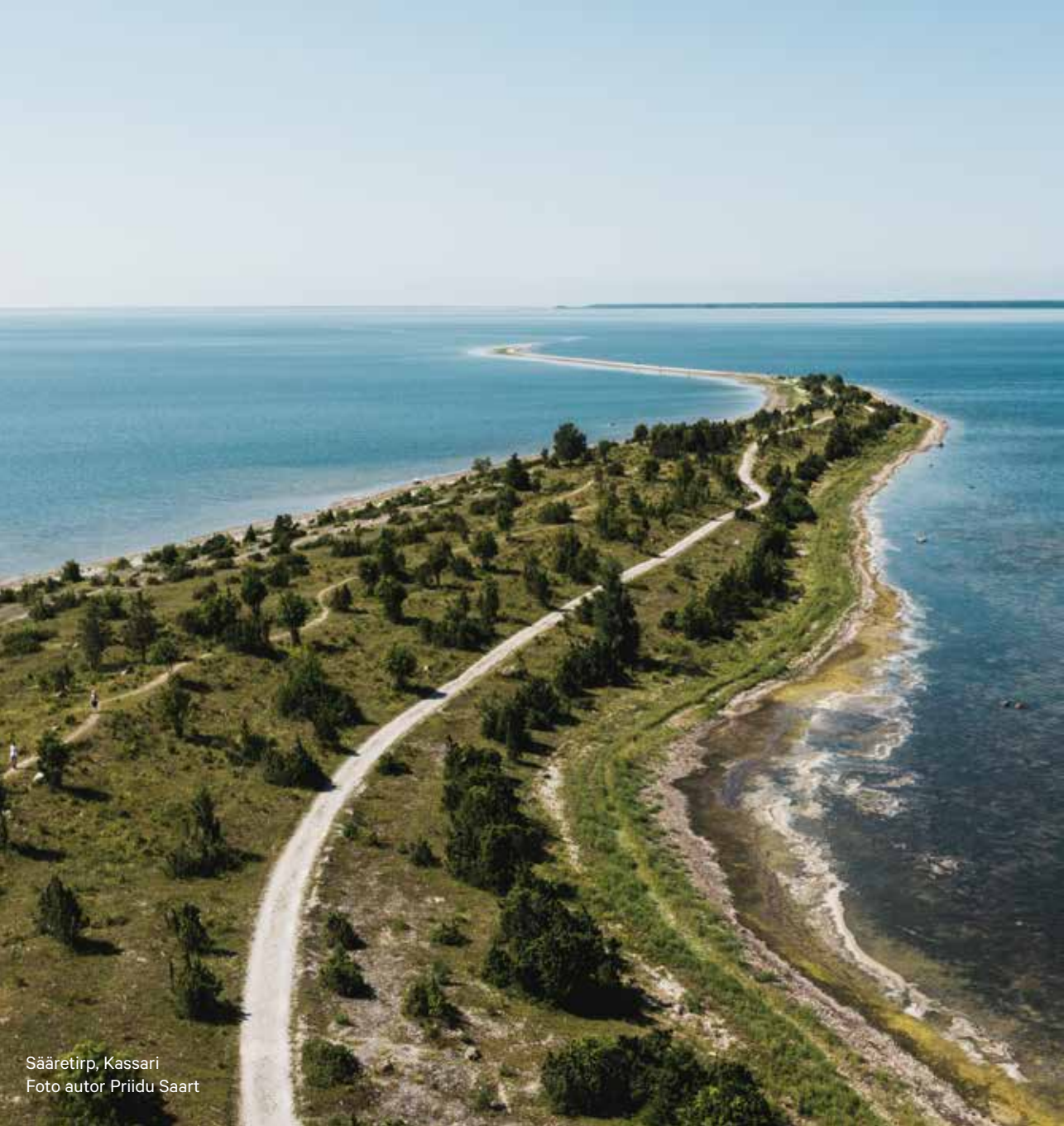
Sääretirp, Kassari