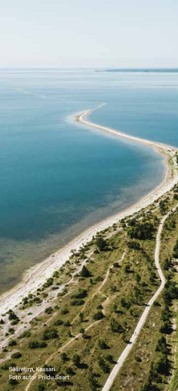
Sääretirp, Kassari